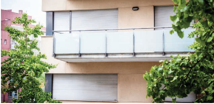
Als pisos de lloguer els canvia la retenció el 2016